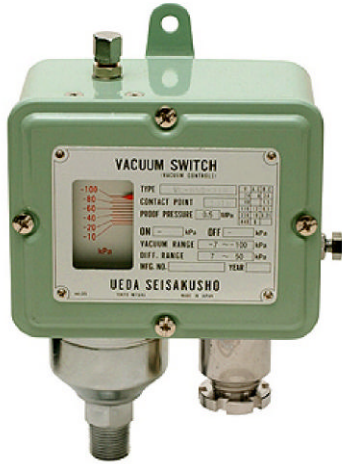
サイズ W.125.5 × D.74.5 × H.174 (mm)