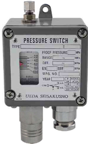
サイズ W.84 × D.60 × H.142.5 (mm)